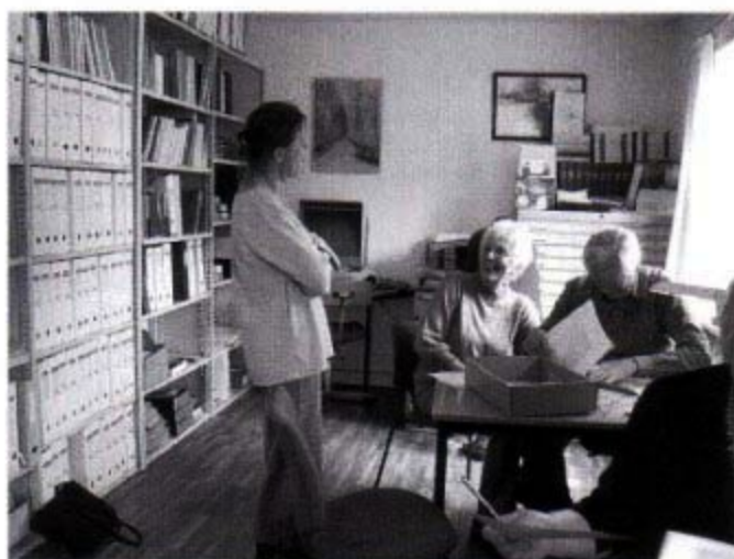
Travlhed i arkivet

Østergade 1 4330 Hvalsø tlf. 46408871 mail lokalarkiv@post.tele.dk Arkivets åbningstider onsdag fra 10 til 14 torsdag 15.30 til 18.30 Første lørdag i hver måned 10 til 12.30 Arkivleder Bente Trane