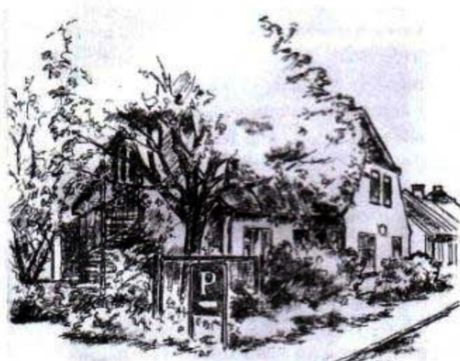
Hvalsø Lokalarkiv, Østergade 1

Bramsnæs Museum og Arkiv Tingstedet 6 Sæby 4070 Kr Hyllinge 46404506 bma@mail.tele.dk Tirsd. 13-16, torsd. 15-20