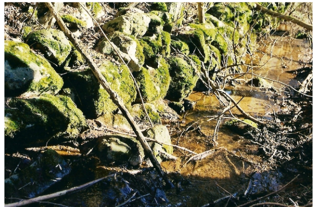
Den stensatte rende, Åstrup