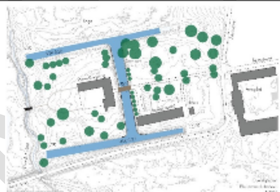
Aastrup Kloster i dag

Rød stiplede streg angiver forlængelsen af Skjoldungestien, blå stiplede streg angiver ny lindeallé ved Åkandevej, mens de sortskraverede områder angiver nye græsningsarealer.