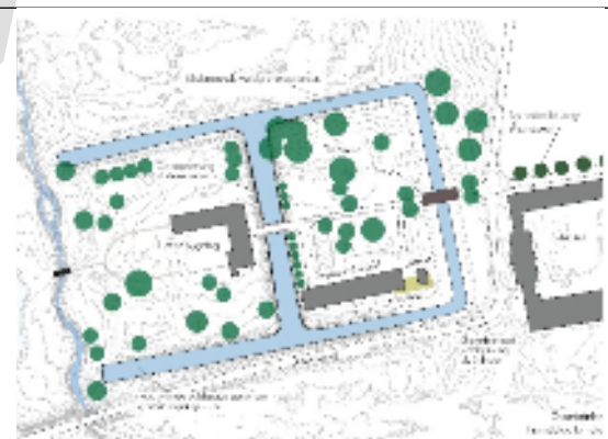
Aastrup Kloster i fremtiden